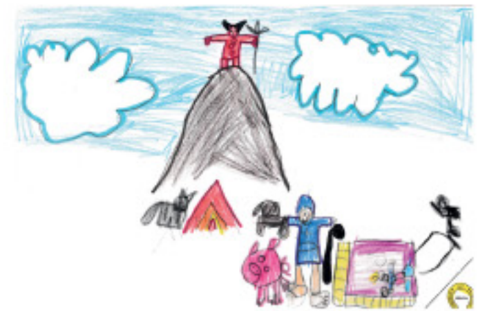
INFANTIL: THAIS LLOPIS CALDÉS